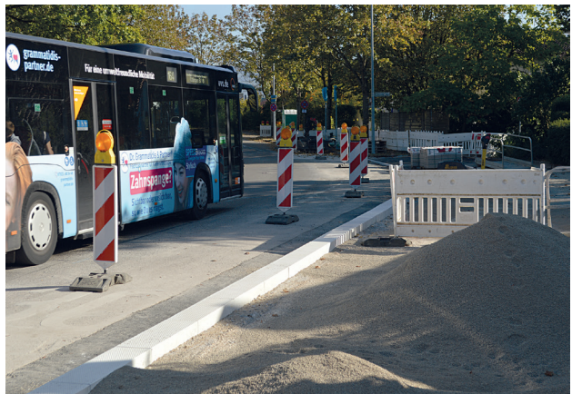
Die Umbauarbeiten an der Haltestelle Habichtweg sind in vollem Gang – Stand 1.10.2023

Unter https://schafhof-kirchheim.de veröffentlichen wir nicht nur Informationen zu unseren Veranstaltungen, sondern ab sofort auch für den Schafhof relevante Stadt-Nachrichten. So auch die Meldung zum barrierefreien Umbau der Schafhof-Haltestellen.